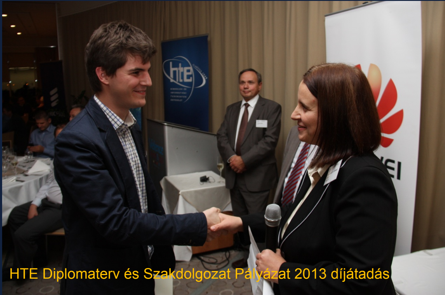
HTE Diplomaterv és Szakdolgozat Pályázat 2013 díjátadás