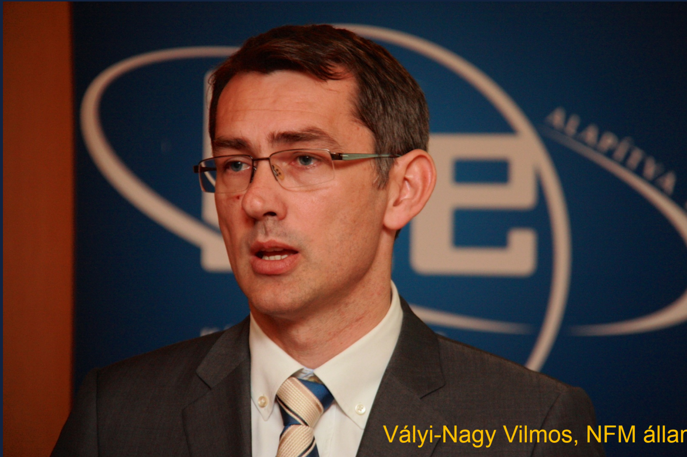
Vályi-Nagy Vilmos, NFM államtitkár