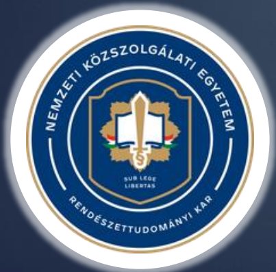
NKE RTK Kiberbűnözés Elleni Tanszék