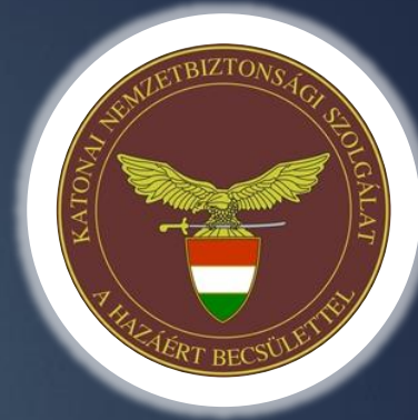
Katonai Nemzetbiztonsági Szolgálat