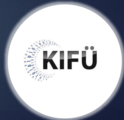
Kormányzati Informatikai Fejlesztési Ügynökség